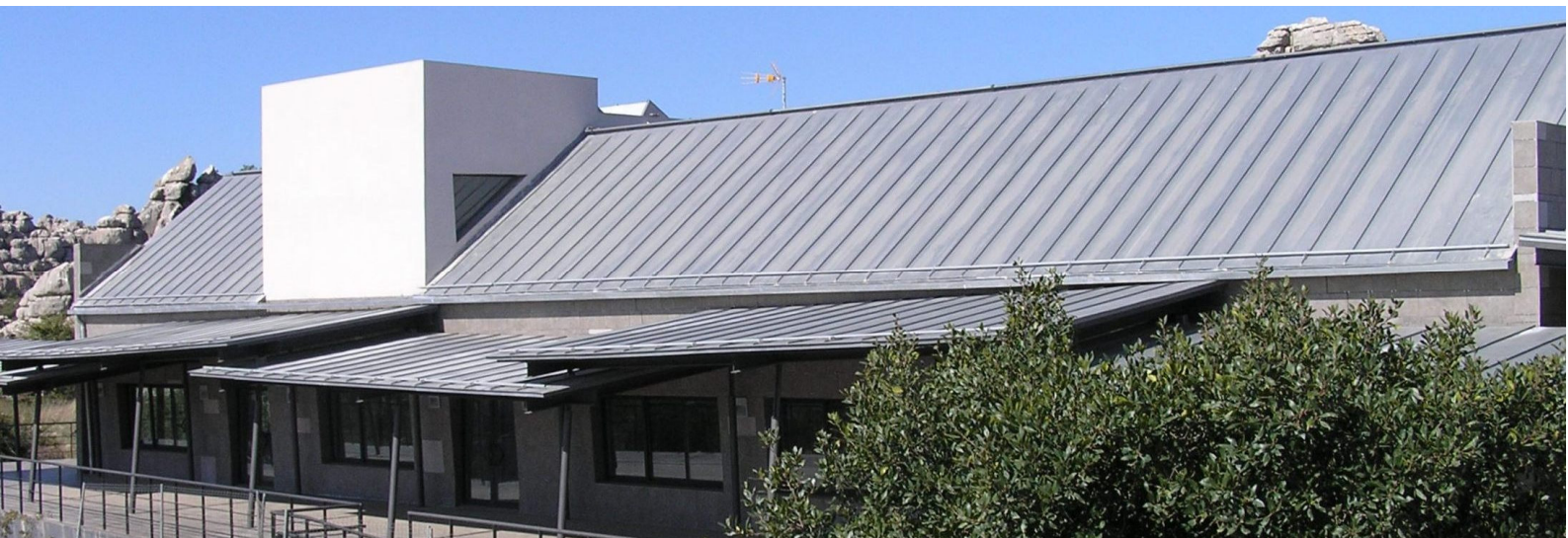
Centro de visitantes, El Torcal de Antequera, Málaga

El conocer los colores de estos materiales es importante a la hora de seleccionar otros materiales y acabados / colores (piedra, lacado carpintería etc.) para la misma obra, así que recomendamos se pongan en contacto con nosotros para solicitarnos muestras nuevas, o mejor aún, solicitar una visita de nuestro asesor técnico para que les enseñe muestras nuevas y envejecidas a la intemperie de estos materiales.